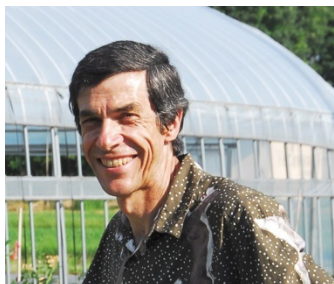
グロッセ・リュック ハイジスト/ピカデナ

花の形に魅せられて行き着いたマンダラの世界。そこには宇宙創造の物語をはじめ、マクロからミクロの世界までの仕組みが秘められている前回に続き、今回は、一日たっぷりマンダラの世界を体感します。